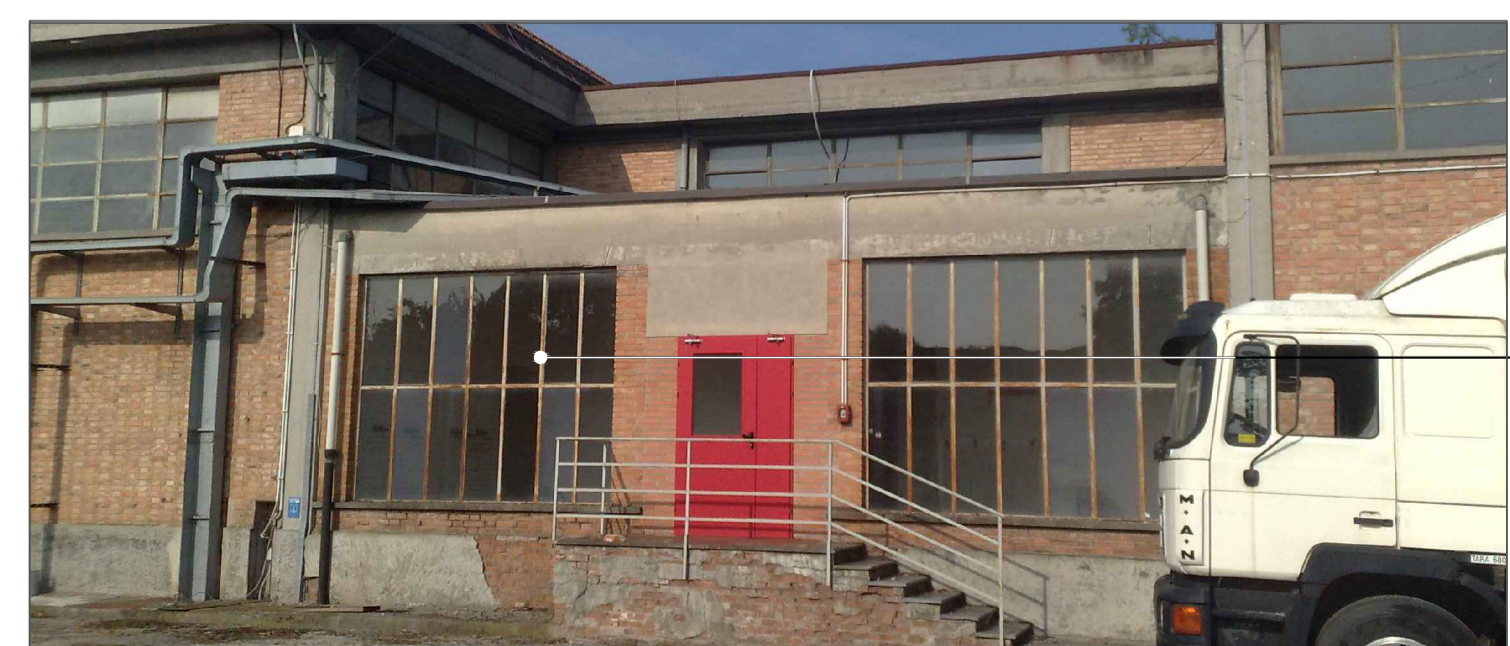
POSIZIONAMENTO SCALA ALLA MARINARA PER ACCESSO ALLA COPERTURA