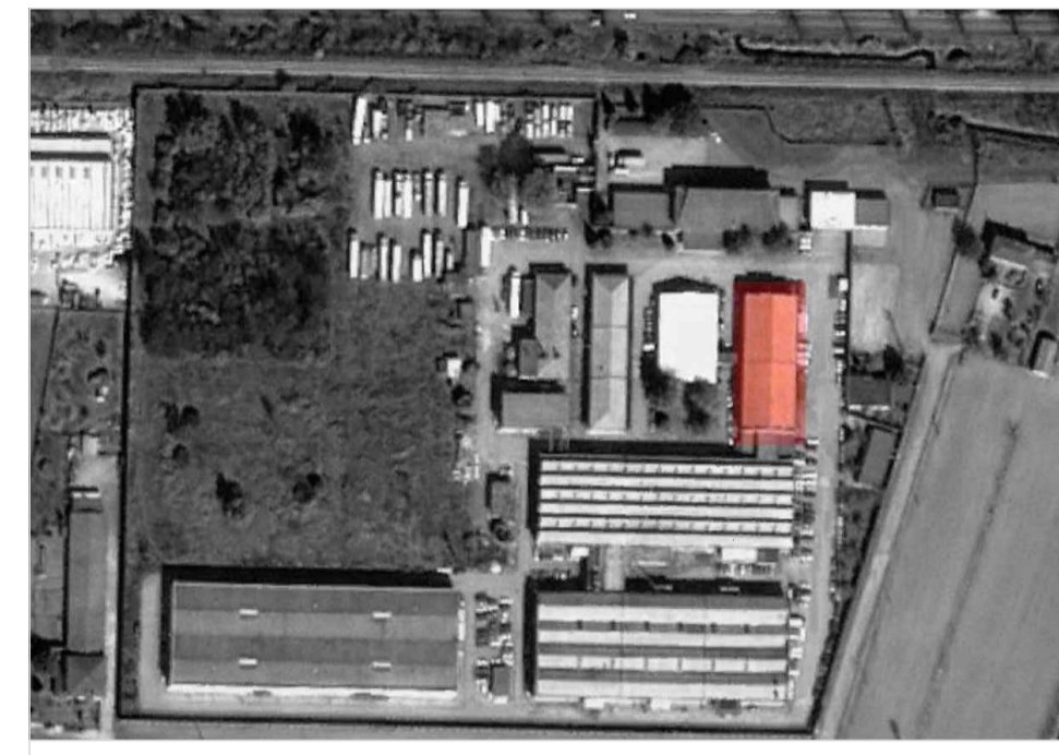
KEY-PLAN - Individuazione fabbricato E