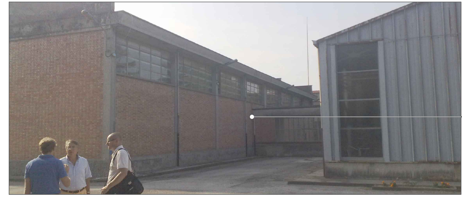
POSIZIONAMENTO SCALA ALLA MARINARA PER ACCESSO ALLA COPERTURA